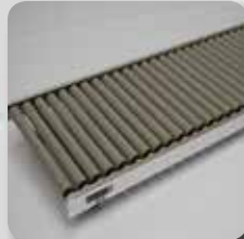
Konveyör / Conveyor A045 GM140RTXL 222-110-111