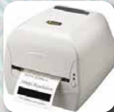
Termal Yazıcı Thermal Printer A130 GM130ETP 222-301-4300170