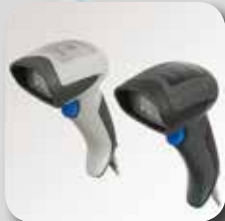
QR Kod Okuyucu QR Code Scanner A150 GM150QRR 222-300-4300730