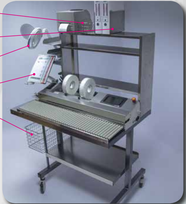
Mini sepet / Mini basket GM250KC_222-110-045